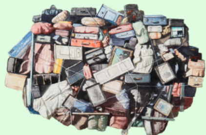
Obra portada: El viaje Cristóbal Toral Técnica mixta, 2005